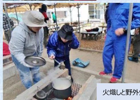
火熾しと野外炊飯