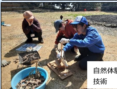
自然体験活動の 技術